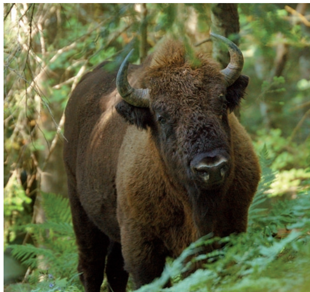
Schon einmal galt das Wisent im Kaukasus als ausgestorben

Die letzten 470 Bergwisente der Welt leben im Kaukasus. Sie sind hoch gefährdet, obwohl ihr letztes Rückzugsgebiet, das circa 300.000 Hektar große Naturreservat „Westkaukasus“, im Jahr 1999 zum UNESCO-Weltnaturerbe ernannt worden ist. Dieses Naturparadies ist ein einzigartiges Beispiel einer großräumigen, weitestgehend unbeeinflussten Hochgebirgslandschaft. Es repräsentiert fast alle Ökosystemtypen des Großen Kaukasus. In dem Naturreservat leben 74 Säugetier-, 246 Vogel- und über 3000 Pflanzenarten. Viele von ihnen sind endemische Kaukasus-Arten, also Tiere oder Pflanzen, die nirgendwo sonst auf der Welt vorkommen. Allein 39 Wirbeltierarten unter ihnen sind gefährdet oder vom Aussterben bedroht.