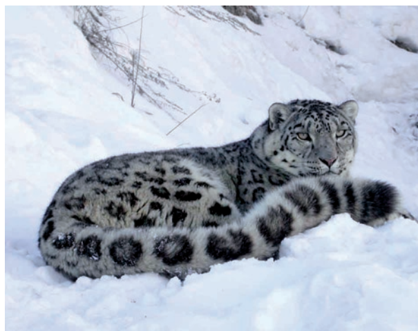
Die Schneeleopardenpopulation ist um mehr als 80 Prozent geschrumpft

Die Kirgisen nennen den Schneeleoparden „Geist der Berge“. Noch Mitte der 1980er-Jahre lebte mit 1200 bis 1400 Tieren ein Großteil der Population in Kirgistan. Heute sind es nach Angaben der kirgisischen Regierung nur noch 300. Zügellose Wilderei hat dazu geführt, dass die Population innerhalb weniger Jahre um mehr als 80 Prozent schrumpfte. Weniger als 2500 zeugungsfähige Schneeleoparden leben noch in den entlegenen Randgebieten der zerklüfteten Berge Zentralasiens und des Himalaya. Unter sowjetischer Herrschaft in den 1970ern und 1980ern waren Fang und Export wilder Tiere ein strikt kontrolliertes Geschäft. Heute erscheint es unvorstellbar, dass damals sowjetische Beamte jährlich etwa 40 Schneeleoparden aus Kirgistan in Zoos weltweit verkauften – zum Preis von 50 US-Dollar.