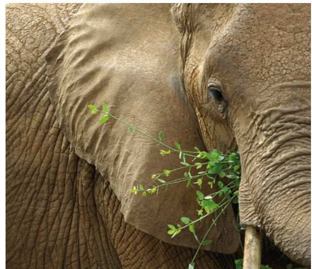
Wilderer töteten in nur zehn Jahren mehr als die Hälfte der Elefanten Afrikas

Die Maasai Mara ist Jahrtausende alt und gilt sogar als ein Weltwunder der Natur. Die Wurzeln unserer eigenen Art reichen bis in die Region zurück. Heute leben mehr als zwei Millionen Menschen in und um das Gebiet der Maasai Mara. Die stetig wachsende Bevölkerung und der Wandel vom Nomadentum zur landwirtschaftlichen Lebensform mit immer größeren Haustierherden belasten das sensible Ökosystem. Die größte Gefahr für die Tiere der Mara stellt die Wilderei dar. Die riesige Nachfrage nach Elfenbein, vor allem in China, kostete in nur zehn Jahren mehr als der Hälfte der Elefanten Afrikas das Leben. Doch auch der Handel mit Buschfleisch aller Wildtierarten blüht. Er ist professionell organisiert, lukrativ und auf dem ganzen Kontinent verbreitet.